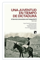
UNA JUVENTUD EN TIEMPOS DE DICTADURA AA.VV.