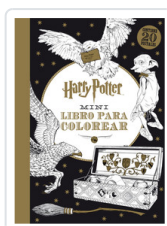
HARRY POTTER: MINI LIBRO PARA COLOREAR AA.VV.