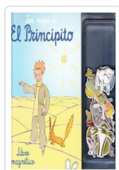
PRINCIPITO: VIAJES - MAGNETICO- AA.VV.