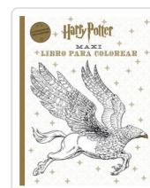
HARRY POTTER: MAXI LIBRO PARA COLOREAR AA.VV.