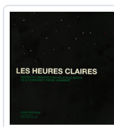
LES HEURES CLAIRES QUETGLAS, JOSEP