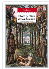
ORO PERDIDO DE LOS ARIENIM, EL BETTO, FREI