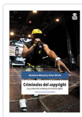
CRIMINALES DEL COPYRIGHT MCLEOD, KENBREW