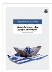
VENDED VUESTRAS ISLAS GRIEGAS ARRUINADOS KAUFMANN, STEPHAN