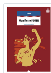
MANIFIESTO FEMEN FEMEN INTERNACIONAL