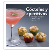
COCTELES Y APERITIVOS MIRALPEIX, ASSUMPTA