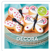
DECORA TUS GALLETAS ESCRIBANO, ROSA Mª