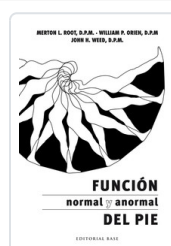
FUNCION NORMAL Y ANORMAL DEL PIE MERTON, L.