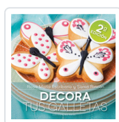
DECORA TUS GALLETAS ESCRIBANO, ROSA Mª