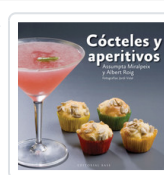
COCTELES Y APERITIVOS MIRALPEIX, ASSUMPTA