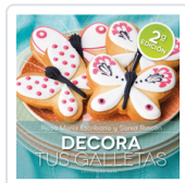
DECORA TUS GALLETAS ESCRIBANO, ROSA Mª