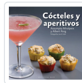
COCTELES Y APERITIVOS MIRALPEIX, ASSUMPTA