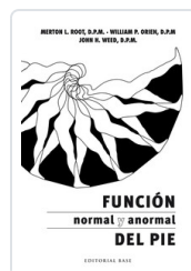
FUNCION NORMAL Y ANORMAL PIE MERTON, L.