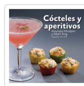
COCTELES Y APERITIVOS MIRALPEIX, ASSUMPTA