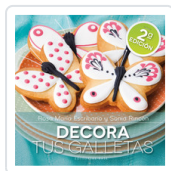
DECORA TUS GALLETAS ESCRIBANO, ROSA Mª