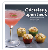
COCTELES Y APERITIVOS MIRALPEIX, ASSUMPTA