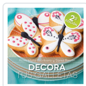
DECORA TUS GALLETAS ESCRIBANO, ROSA Mª