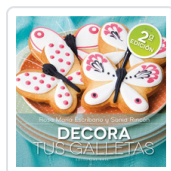
DECORA TUS GALLETAS ESCRIBANO, ROSA Mª