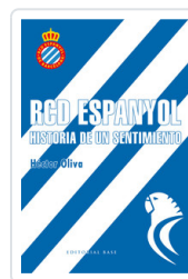
RCD ESPANYOL OLIVA, HECTOR