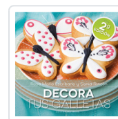
DECORA TUS GALLETAS ESCRIBANO, ROSA Mª