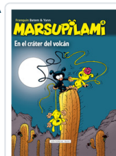
MARSUPILAMI, 4 EN EL CRATER VOLCAN FRANQUIN, ANDRE