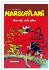
MARSUPILAMI, 3 NOVATO DE LA SELVA FRANQUIN, ANDRE