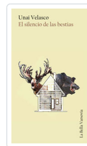
SILENCIO DE LAS BESTIAS VELASCO, UNAI