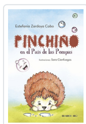
PINCHINO EN EL PAIS DE LAS POMPAS ZARDOYA, ESTEFANIA