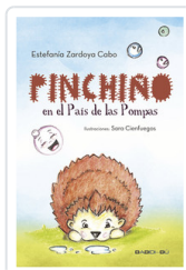
PINCHIÑO EN EL PAIS DE LAS POMPAS ZARDOYA, ESTEFANIA