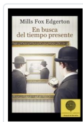
EN BUSCA DEL TIEMPO PRESENTE FOX, MILLS