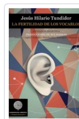
FERTILIDAD DE LOS VOCABLOS HILARIO, JESUS