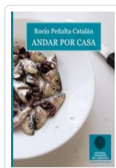
ANDAR POR CASA PENÁLTA, ROCIO