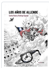
AÑOS DE ALLENDE, LOS ELGUETA, RODRIGO