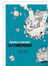
COMUNIDAD, 2 TANQUERELLE, HERVE