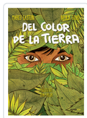
DEL COLOR DE LA TIERRA GASTONI, MARCO/ GOBBI, NICOLA