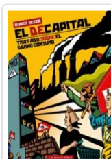
DECAPITAL, EL UCEDA, RUBEN