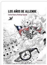
AÑOS DE ALLENDE, LOS ELGUETA, RODRIGO