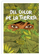
DEL COLOR DE LA TIERRA GASTONI, MARCO/ GOBBI, NICOLA