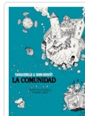
COMUNIDAD, 2 TANQUERELLE, HERVE