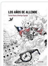
AÑOS DE ALLENDE, LOS ELGUETA, RODRIGO