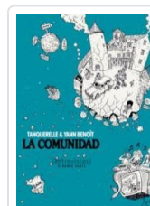
COMUNIDAD, 2 TANQUERELLE, HERVE