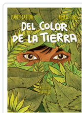
DEL COLOR DE LA TIERRA GASTONI, MARCO/ GOBBI, NICOLA