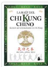
RAIZ DEL CHI KUNG CHINO YANG, JWING-MING