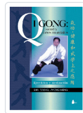
QIGONG SALUD Y ARTES MARCIALES YANG, JWING-MING