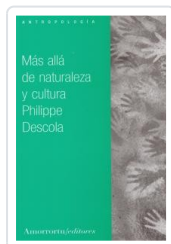
MAS ALLA DE NATURALEZA Y CULTURA DESCOLA, PHILIPPE