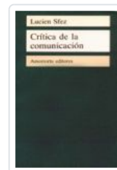
CRITICA DE LA COMUNICACION SFEZ, LUCIEN