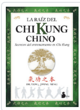
RAIZ DEL CHI KUNG CHINO YANG, JWING-MING