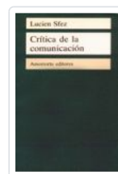
CRITICA DE LA COMUNICACION SFEZ, LUCIEN