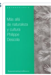
MAS ALLA DE NATURALEZA Y CULTURA DESCOLA, PHILIPPE