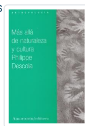
MAS ALLA DE NATURALEZA Y CULTURA DESCOLA, PHILIPPE