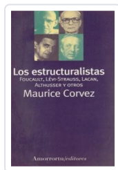
ESTRUCTURALISTAS, LOS CORVEZ, MAURICE