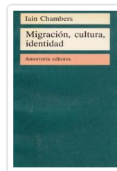
MIGRACION CULTURA IDENTIDAD CHAMBERS, IAIN