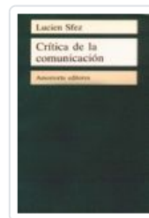
CRITICA DE LA COMUNICACION SFEZ, LUCIEN