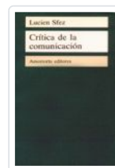
CRITICA DE LA COMUNICACION SFEZ,LUCIEN