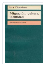
MIGRACION CULTURA IDENTIDAD CHAMBERS, IAIN