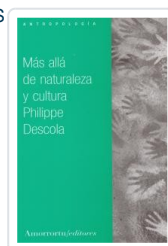
MAS ALLA DE NATURALEZA Y CULTURA DESCOLA, PHILIPPE