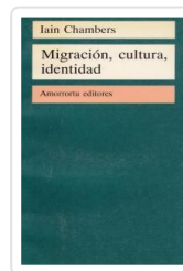
MIGRACION CULTURA IDENTIDAD CHAMBERS, IAIN