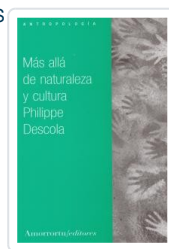
MÁS ALLA DE NATURALEZA Y CULTURA DESCOLA, PHILIPPE