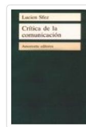
CRITICA DE LA COMUNICACION SFEZ, LUCIEN