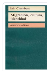
MIGRACION CULTURA IDENTIDAD CHAMBERS, IAIN