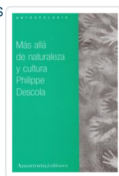
MAS ALLA DE NATURALEZA Y CULTURA DESCOLA, PHILIPPE