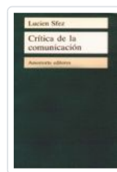
CRITICA DE LA COMUNICACION SFEZ,LUCIEN