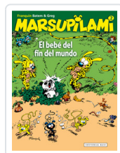
MARSUPIAMI, 2 BEBE FIN FRANQUIN, ANDRE