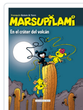
MARSUPIAMI, 4 EN EL CRATER VOLCAN FRANQUIN, ANDRE