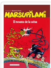
MARSUPIAMI, 3 NOVATO DE LA SELVA FRANQUIN, ANDRE