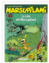
MARSUPIAMI, 1 LA COLA FRANQUIN, ANDRE