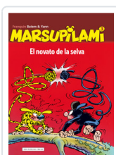
MARSUPILAMI, 3 NOVATO DE LA SELVA FRANQUIN, ANDRE