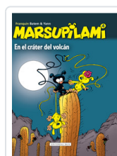
MARSUPILAMI, 4 EN EL CRATER VOLCAN FRANQUIN, ANDRE