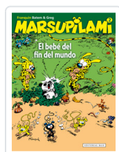
MARSUPILAMI, 2 BEBE FIN FRANQUIN, ANDRE