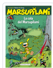
MARSUPILAMI, 1 LA COLA FRANQUIN, ANDRE