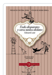
TODO DISPARATES Y OTROS TANTOS DISLATÉS LEAR, EDWARD