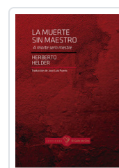
MUERTE SIN MAESTRO, LA HELDER, HERBERTO