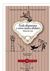
TODO DISPARATES Y OTROS TANTOS DISLATES LEAR, EDWARD