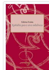
EPITAFIO PARA UNA ODALISCA FRUTOS, FATIMA