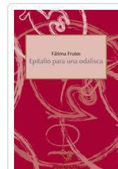
EPITAFIO PARA UNA ODALISCA FRUTOS, FATIMA