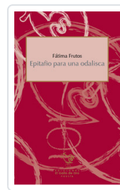
EPITAFIO PARA UNA ODALISCA FRUTOS, FATIMA