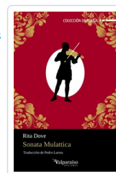
SONATA MULATTICA DOVE, RITA