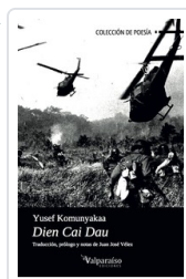
DIEN CAI DAU KOMUNYAKAA, YUSEF