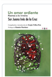
UN AMAR ARDIENTE DE LA CRUZ, SOR J. INES