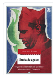
LLUVIA DE AGOSTO ALVAREZ, FRANCISCO