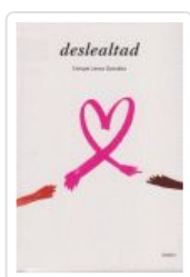
DESLEALTAD LENZA, ENRIQUE