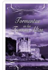
TORMENTAS EN LAS TIERRAS ALTAS COURTENAY, CRISTINA