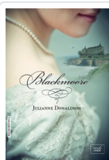
BLACKMOORE DONALDSON, JULIANNE