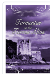
TORMENTAS EN LAS TIERRAS ALTAS COURTENAY, CRISTINA