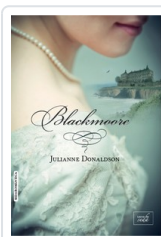
BLACKMOORE DONALDSON, JULIANNE