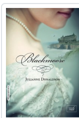
BLACKMOORE DONALDSON, JULIANNE