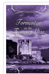
TORMENTAS EN LAS TIERRAS ALTAS COURTENAY, CRISTINA