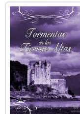
TORMENTAS EN LAS TIERRAS ALTAS COURTENAY, CRISTINA