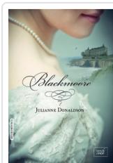
BLACKMOORE DONALDSON, JULIANNE