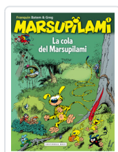
MARSUPILAMI, 1 LA COLA FRANQUIN, ANDRE