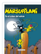
MARSUPILAMI, 4 EN EL CRATER VOLCAN FRANQUIN, ANDRE