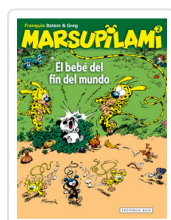
MARSUPILAMI, 2 BEBE FIN FRANQUIN, ANDRE